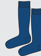
Medias 3/4 Azul marino