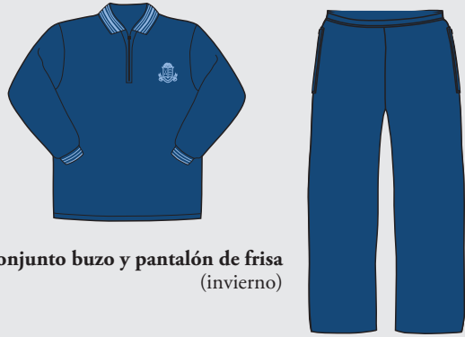
Conjunto buzo y pantalón de frisa (invierno)