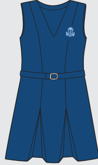
Jumper Uso exclusivo de Años 1 a 4 inclusive