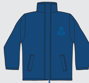
Campera reversible [de uso opcional]