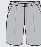
Bermuda Arciel Uso exclusivo de Años 1 a 4 inclusive [de uso opcional]