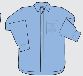
Camisa manga larga Verano e invierno