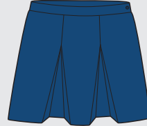
Pollera De Años 5 a 12