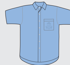
Camisa manga corta De Años 1 a 6 Verano [de uso opcional]