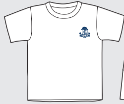
Remera (verano e invierno)