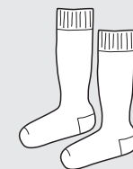
Medias blancas Clases de Educación Física [Años 1 y 2 únicamente]