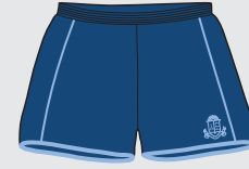
Shorts Clases de Educación Física, Atletismo y Volleyball