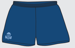
Shorts Clases de Educación Física, Atletismo, Rugby y Football