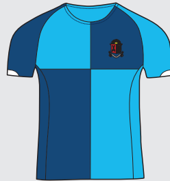
Camiseta Varones: a partir de Año 3 De uso diario Niñas: a partir de Año 4 Para competencias intercolegiales