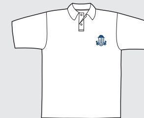
Remera Polo Clases de Educación Física