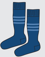
Medias azules Clases de Educación Física [Años 3 a 12]