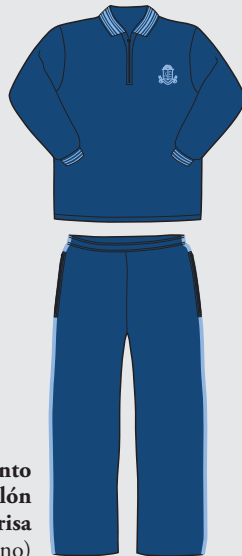
Conjunto buzo y pantalón de frisa (invierno)