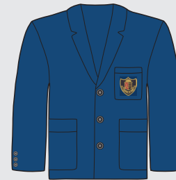
Blazer con escudo bordado cosido