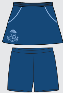
Pollera y calzas para Hockey Para competencias intercolegiales [Niñas únicamente]