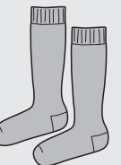
Medias 3/4 Gris