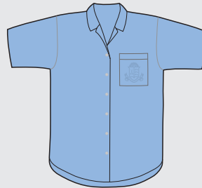
Blusa manga corta Verano [de uso opcional]