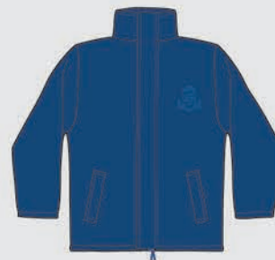
Campera reversible [de uso opcional]