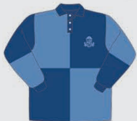
Camiseta de Rugby Para competencias intercolegiales [ Varones únicamente ]