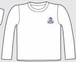
Remera (invierno) [de uso opcional]