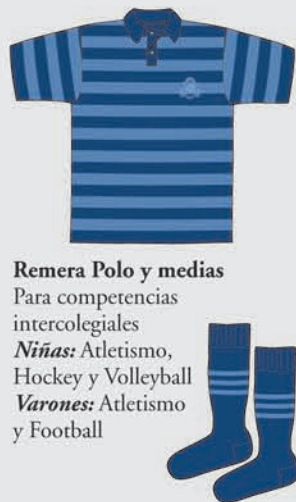
Remera Polo y medias Para competencias intercolegiales Niñas: Atletismo, Hockey y Volleyball Varones: Atletismo y Football