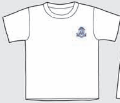
Remera (verano e invierno)