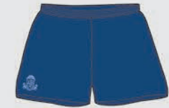
Shorts Clases de Educación Física, y Niñas: Atletismo y Volleyball Varones: Atletismo, Rugby y Football