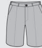
Bermuda Arciel Uso exclusivo de 1º a 4º Año inclusive [de uso opcional]