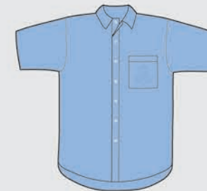
Camisa manga corta De 1º a 7º Año únicamente Verano [de uso opcional]