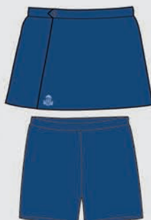
Pollera cruzada y calzas para Hockey Para competencias intercolegiales [ Niñas únicamente ]