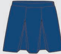
Pollera De 5º a 12º Año