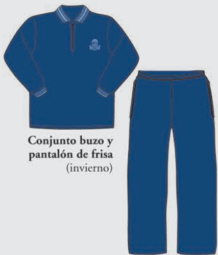
Conjunto buzo y pantalón de frisa (invierno)