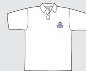
Remera Polo Clases de Educación Física