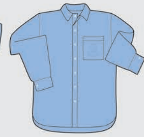
Camisa manga larga Verano e invierno