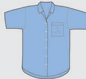
Blusa manga corta Verano [de uso opcional]