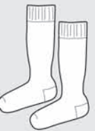
Medias blancas Clases de Educación Física