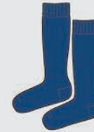
Medias 3/4 Azul marino