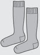
Medias 3/4 Gris