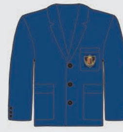
Blazer con escudo bordado cosido