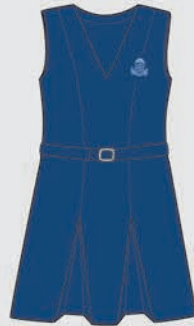
Jumper Uso exclusivo de 1º a 4º Año inclusive